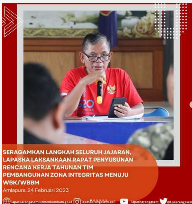
SERAGAMKAN LANGKAH SELURUH JAJARAN, LAPASKA LAKSANKAN RAPAT PENYUSUNAN RENCANA KERJA TAHUNAN TIM PEMBANGUNAN ZONA INTEGRITAS MENUJU WBK/WBBM

Kalapas membuka rapat dengan menyampaikan dan memaparkan rekomendasi dari Tim Pembina Kantor Wilayah terkait Penguatan Pembangunan Zona Integritas yang dilaksanakan beberapa waktu lalu. Disampaikan beberapa hal yang masih kurang yang ditemukan setelah proses verifikasi berkas awal oleh Tim Pembina Kanwil Kemenkumham Bali.