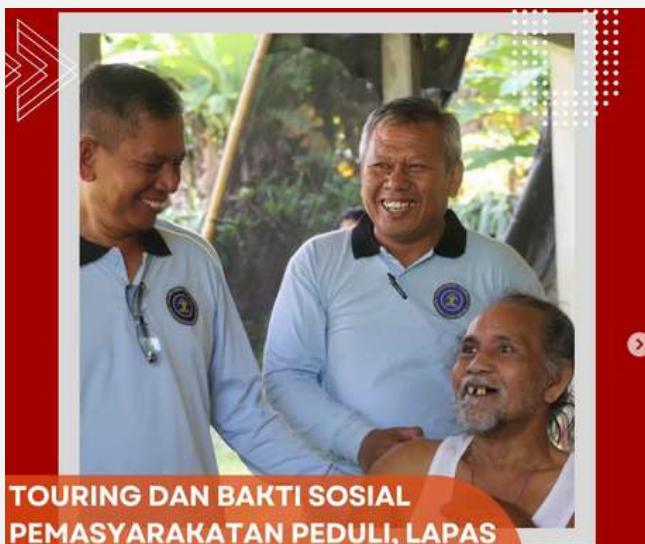
TOURING DAN BAKTI SOSIAL PEMASYARAKATAN PEDULI, LAPAS KARANGASEM LAKSANAKAN BAKTI SOSIAL