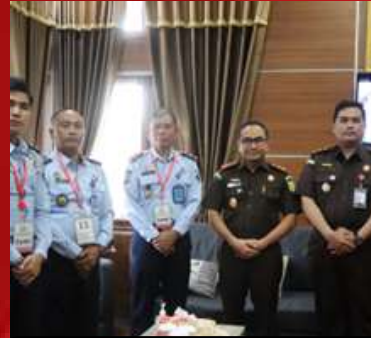
Kejaksaan Negeri Karangasem