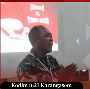
Kodim 1623 Karangasem