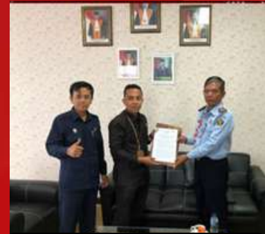
Pengadilan Agama Karangasem