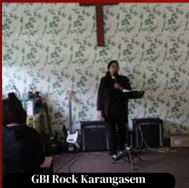
GBI Rock Karangasem