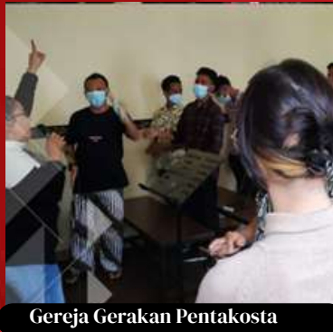
Gereja Gerakan Pentakosta