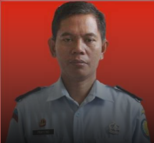
KEPALA LAPAS KARANGASEM