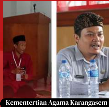
Kementertian Agama Karangasem