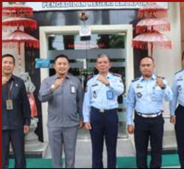
Pengadilan Negeri Amlapura