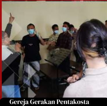
Gereja Gerakan Pentakosta