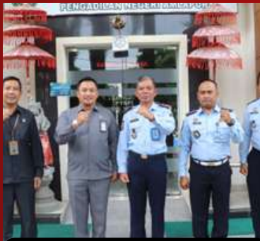
Pengadilan Negeri Amlapura