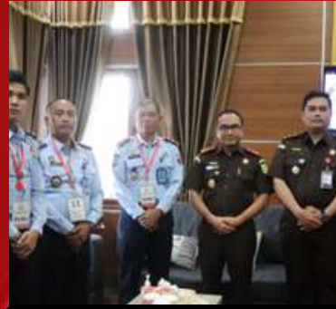
Kejaksaan Negeri Karangasem