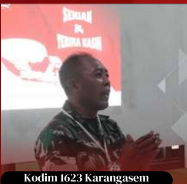
Kodim 1623 Karangasem