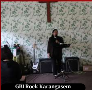
GBI Rock Karangasem